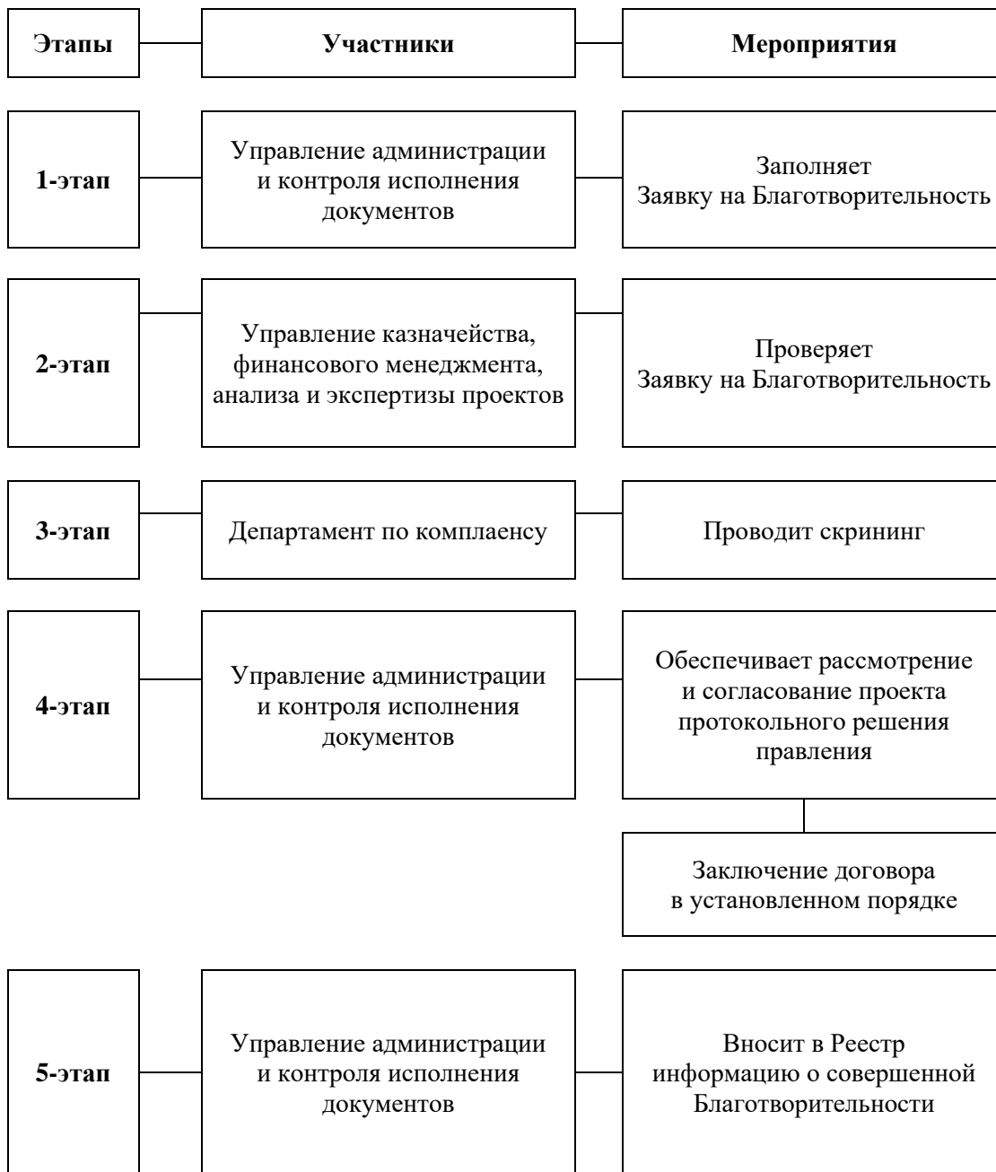
СХЕМА процедуры по Благотворительности